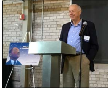
Bob Schwemm phát biểu trước đám đông

sư luật của Trường cao đẳng luật thuộc Đại học Kentucky). Ông Schwemm đã thảo luận những sự kiện dẫn đến việc xây dựng và sau đó thông qua Bộ luật Nhà ở Công bằng 1968. Ông cũng